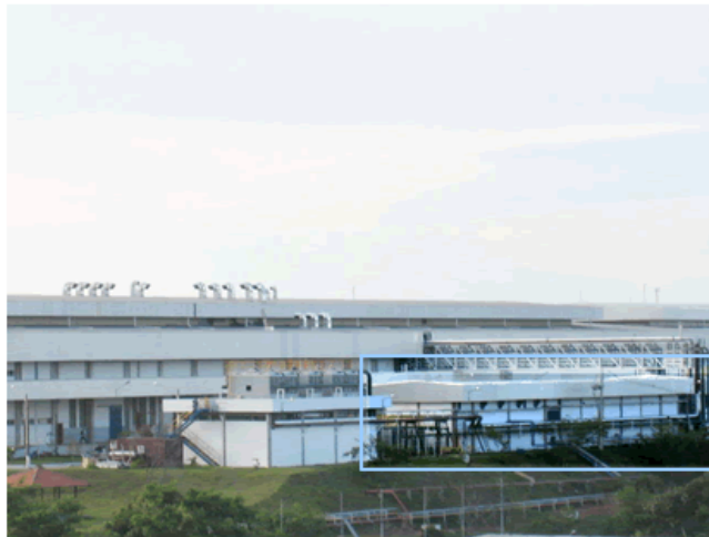
Subestação 8000 KvA