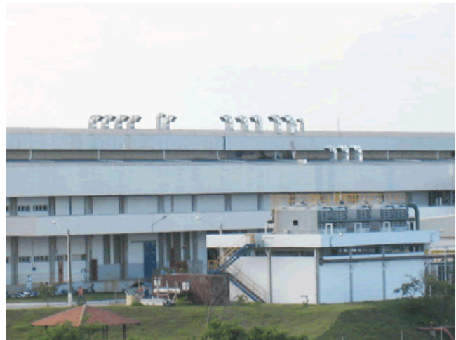
Sala de Compressores e Manutenção