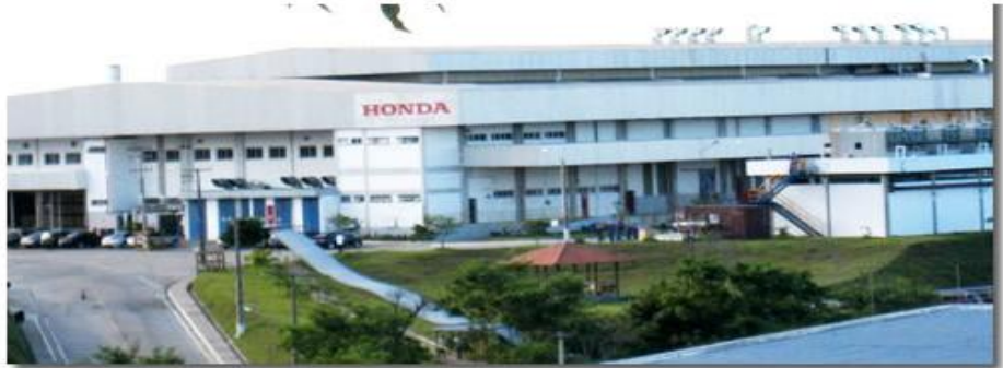
Fábrica Honda Motors Manaus - AM